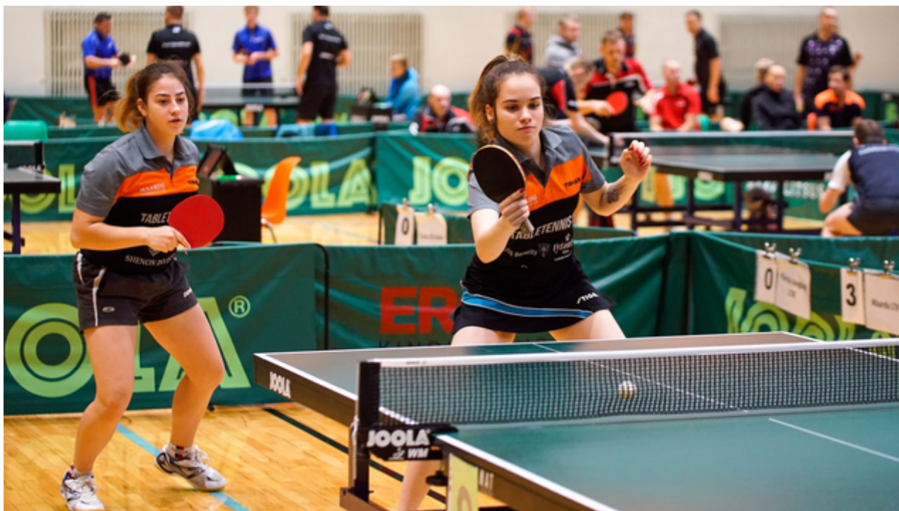
Pildil eelmise aasta võitjad